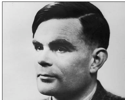
Alan Mathison Turing (1912 - 1954)

Britischer Logiker, Mathematiker und Computerpionier